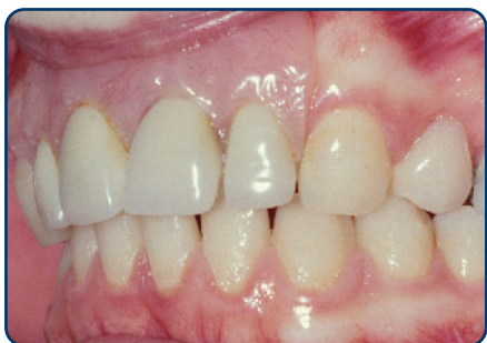
Plaatprothese van opzij