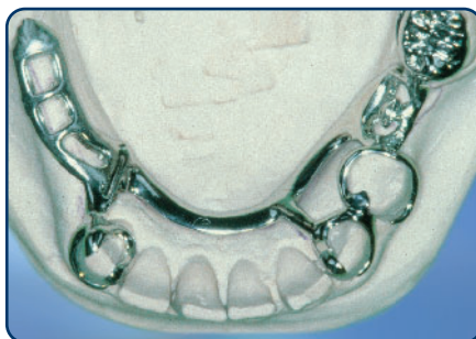
Frameprothese in wording op een gipsmodel, zonder kunsttanden en -kiezen

soort slotje. Bij een slotje wordt de ene kant vastgemaakt aan een kroon, tand of kies en de andere kant zit vast aan de frameprothese. De frameprothese kunt u op die manier in het slotje schuiven. Het slotje zit doorgaans aan de binnenkant van de tanden en kiezen en is dus niet vanaf de buitenkant zichtbaar. Ankertjes zijn vaak wel enigszins zichtbaar.