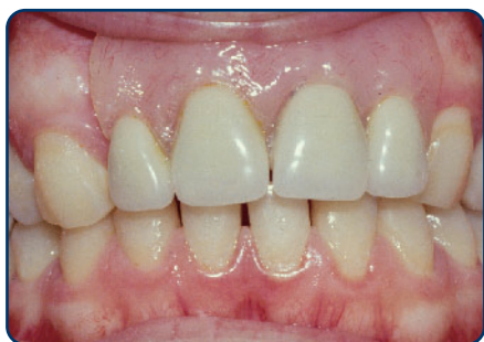
Plaatprothese van voren

De plaatprothese is gemaakt van een roze, tandvleeskleurige kunsthars. Daarin zijn de kunsttanden en -kiezen verankerd. De gehele plaatprothese rust op het slijmvlies van de mond. Deze zit eventueel met ankertjes vast aan overgebleven tanden of kiezen.