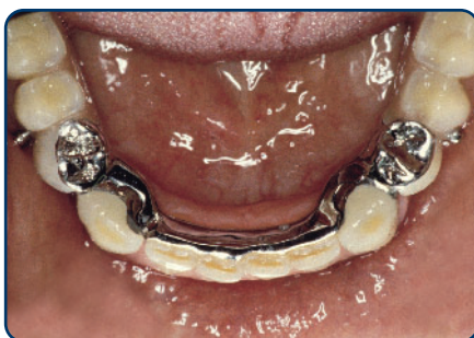
Frameprothese met verankering op kronen